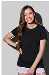
ST2600 Classic-T Fitted